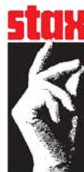
Le célèbre logo