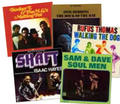
Quelques uns des plus grands succès de la Stax

Depuis sa création, plus de 4000 étudiants sont sortis diplômés de la Stax Music Academy. Depuis 2008, tous les élèves ont été acceptés dans une université. Un grand nombre d'entre eux ont reçu une bourse pour financer leurs études. Les anciens élèves de l'Académie sont désormais enseignant, chanteur, musicien, ou cadres de l'industrie musicale. Les étudiants et ex-étudiants de la Stax Music Academy continuent de contribuer au son de Memphis.