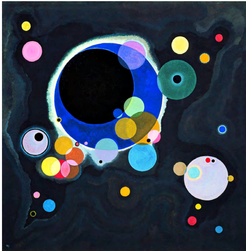
« Quelques cercles », 1926, huile sur toile, Guggenheim Museum à New York

- observer et décrire une deuxième œuvre de Kandinsky, toujours composée de cercles colorés mais à la composition beaucoup plus libre que la première :