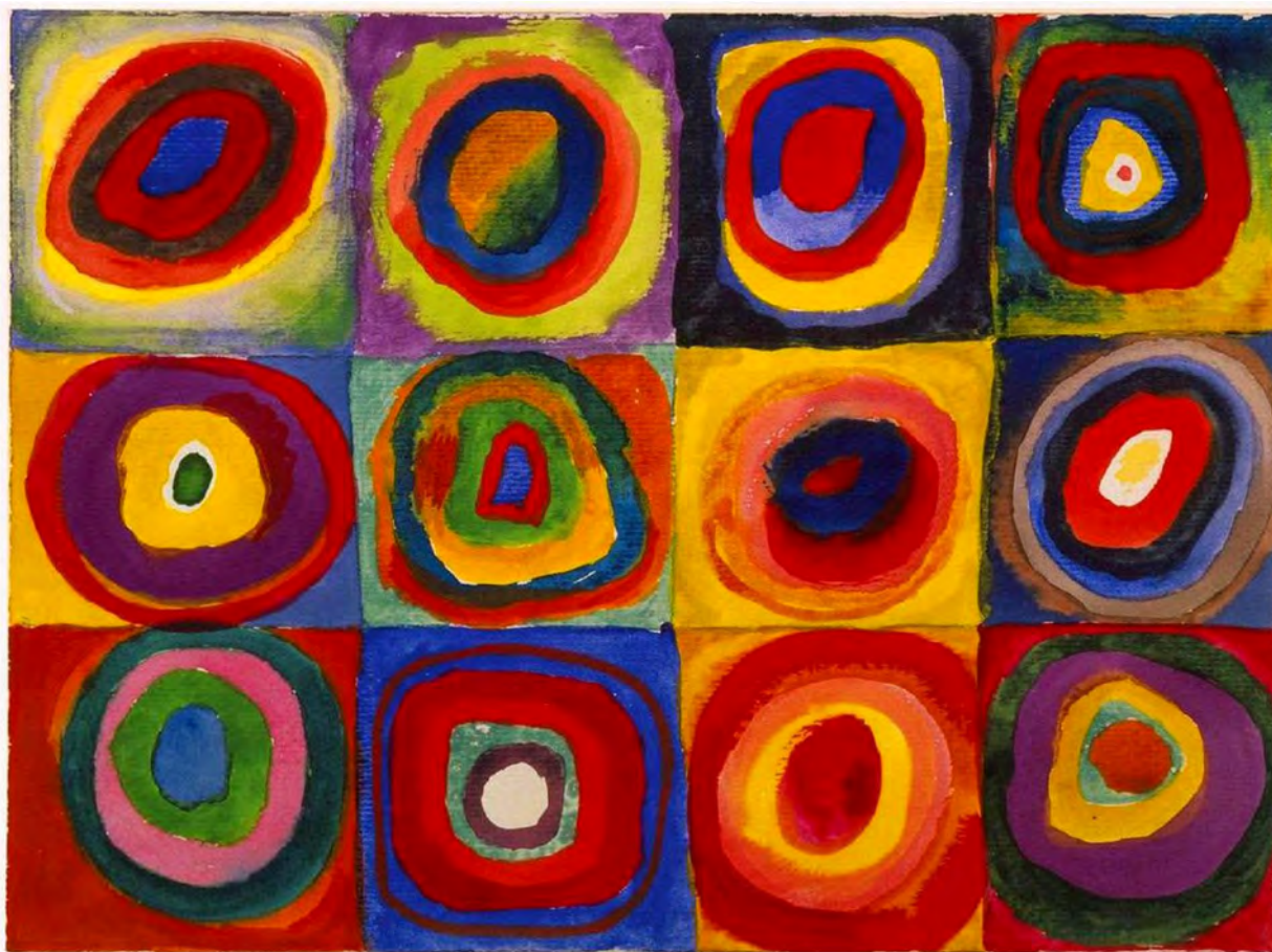
« Etude de couleurs, carrés avec cercles concentriques », Kandinsky, 1913 Aquarelle, gouache, craie de cire sur papier. Musée Lenbachhaus, Munich